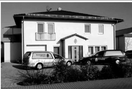
Brandäcker 2, Scheßlitz