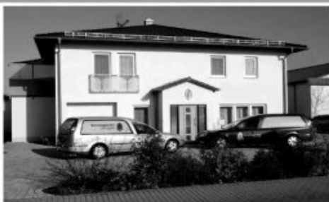
Brandäcker 2, Scheßlitz

Bamberg, 09.07.2020 gez. Rainer Albart Baudirektor