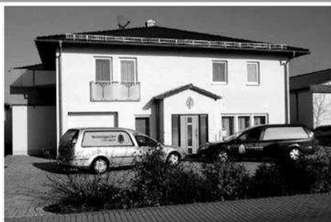
Brandäcker 2, Scheßlitz

Wir stellen uns den regionalen Wettbewerb und bitten um Ihre Un- terstützung. Wir bieten Ihnen eine Reihe von Möglichkeiten unsere Produkte zu erwerben: In Weismain, Am Markt 23, Christls Lädla, (da kommt jeden Mittwoch der Leberkäseexpress), unsere Ver- kaufsanhänger finden Sie jeden Freitag von 11.30 bis 17.30 in Scheßlitz, am Autohaus Bärenstrauch und in Kulmbach, vor dem Autohaus Dippold und Samstag jeweils von 7-12 in Mainleus, Industriestraße, am Getränkemarkt und in Hirschaid, vor dem Rat- haus und natürlich in unserem Hauptgeschäft in Zedersitz 16. Bitte bringen Sie Ihre Stofftaschen mit; einfach unserer Umwelt zu liebe. Falls Sie noch keine haben, sie sind wieder eingetroffen.