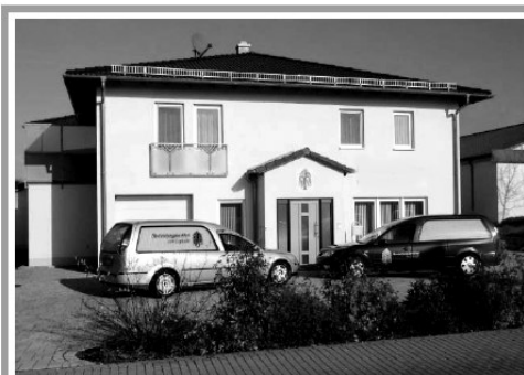
Brandäcker 2, Scheßlitz