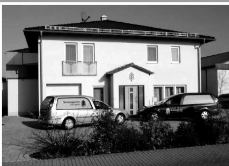
Brand cker 2, Sche litz