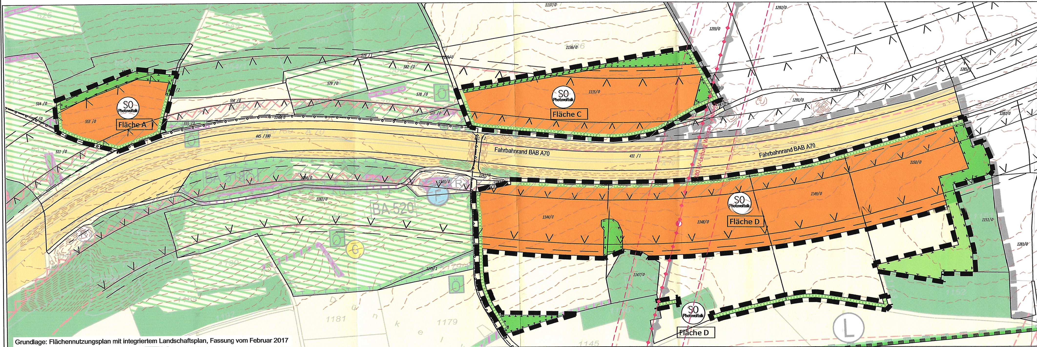
Grundlage: Flächennutzungsplan mit integriertem Landschaftsplan, Fassung vom Februar 2017

6. Die Stadt Scheßlitz hat mit Beschluss des Stadtrats vom 03.03.2020 die 4. Änderung des Flächennutzungsplans in der Fassung vom 03.03.2020 festgestellt.