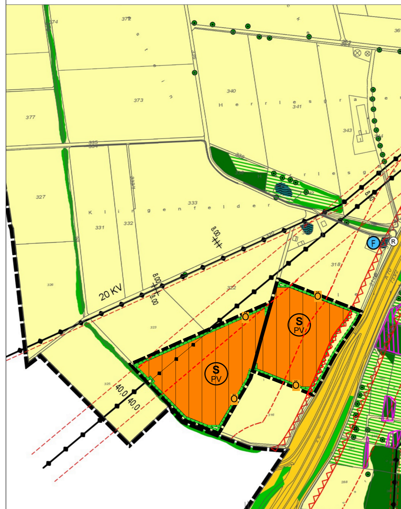
Kartengrundlage: Flächennutzungsplan (digitalisierte Fassung)