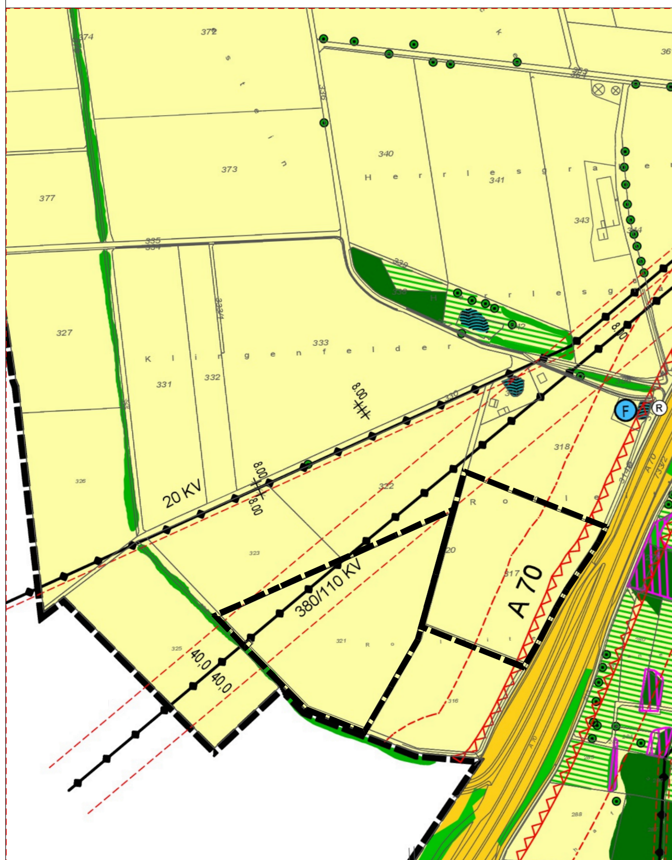
Kartengrundlage: Flächennutzungsplan (digitalisierte Fassung)