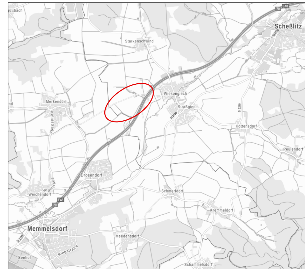
Geobasisdaten © Bayerische Vermessungsverwaltung